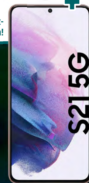
SAMSUNG Galaxy S21 5G

Jetzt bis zu 615 € ** für dein Altgerät erhalten!