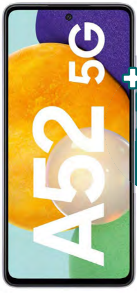
SAMSUNG Galaxy A52 5G

Samsung Galaxy A52 5G im Neuvertrag MagentaMobil Special m. Smartphone 8 mit einer Mindestlaufzeit von 24 Monaten nur 1,00 € * Farbe: