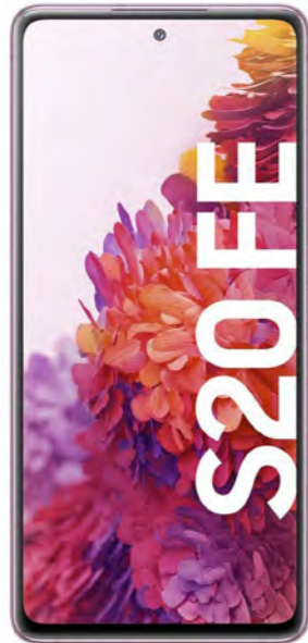
SAMSUNG Galaxy S20 FE

Xiaomi Mi 10T Pro 5G im Neuvertrag MagentaMobil S Young m. Smartphone 6 mit einer Mindestlaufzeit von 24 Monaten nur 1,00 € * Farbe: