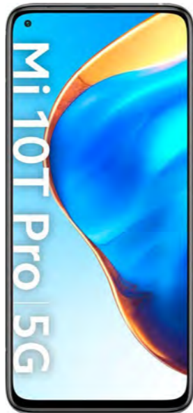
MI 10T Pro 5G xiaomi

Xiaomi Mi 10T Pro 5G im Neuvertrag MagentaMobil S Young m. Smartphone 6 mit einer Mindestlaufzeit von 24 Monaten nur 1,00 € * Farbe: